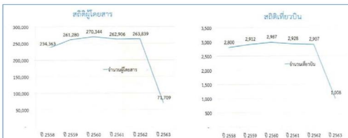
สถิติจำนวนผู้โดยสารผ่านเข้าออกจังหวัดเลย ปี 2558 - 2563

ที่มา : แขวงทางหลวงที่ 1 , แขวงทางหลวงที่ 2 , สำนักงานทางหลวงชนบทจังหวัดเลย , ท่าอากาศยานเลย