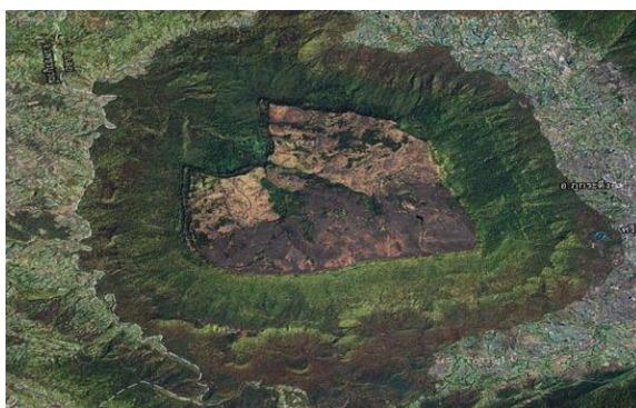
ภาพถ่ายดาวเทียม อุทยานแห่งชาติภูกระดึง อําเภอกุกระดิง จังหวัดเลย