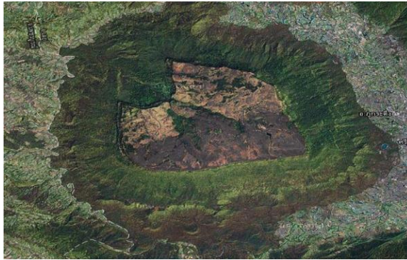
ภาพถ่ายดาวเทียม อุทยานแห่งชาติภูกระดึง อ่างเก็บน้ำภูกระดึง จังหวัดเลย