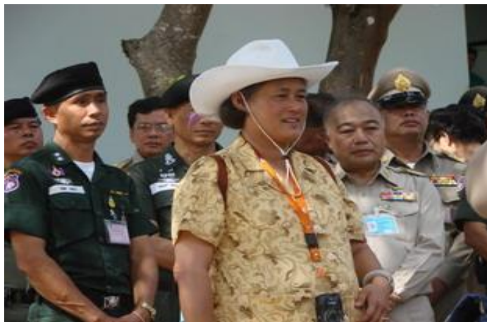
สมเด็จพระเทพรัตนราชสุดาฯ สยามบรมราชกุมารี เสด็จพระราชดำเนินไปทรงปฏิบัติพระราชกรณียกิจในพื้นที่ จังหวัดเลย ระหว่างวันที่ 25 - 26 มกราคม 2553

โรงเรียนตำรวจตระเวนชายแดนจังหวัดเลย 7 แห่ง ได้แก่